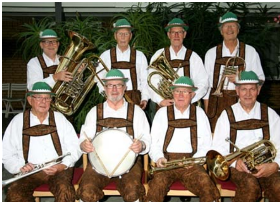
Kongeå Blæseorkester, som kommer i forsamlingshuset torsdag d. 3 oktober

Arrangementerne om torsdagen i forsamling koster kr. 40,- for medlemmer og kr. 50,- for ikke-medlemmer. Alle er velkomne. Der er hver gang kaffebord med hjemmebagt brød.