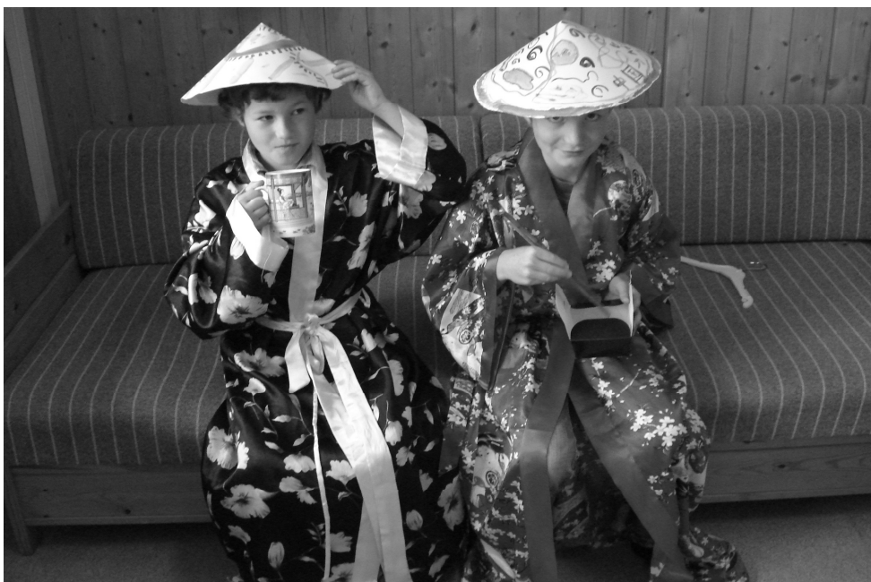
2. og 3. klasse har arbejdet med emnet Kina og OL