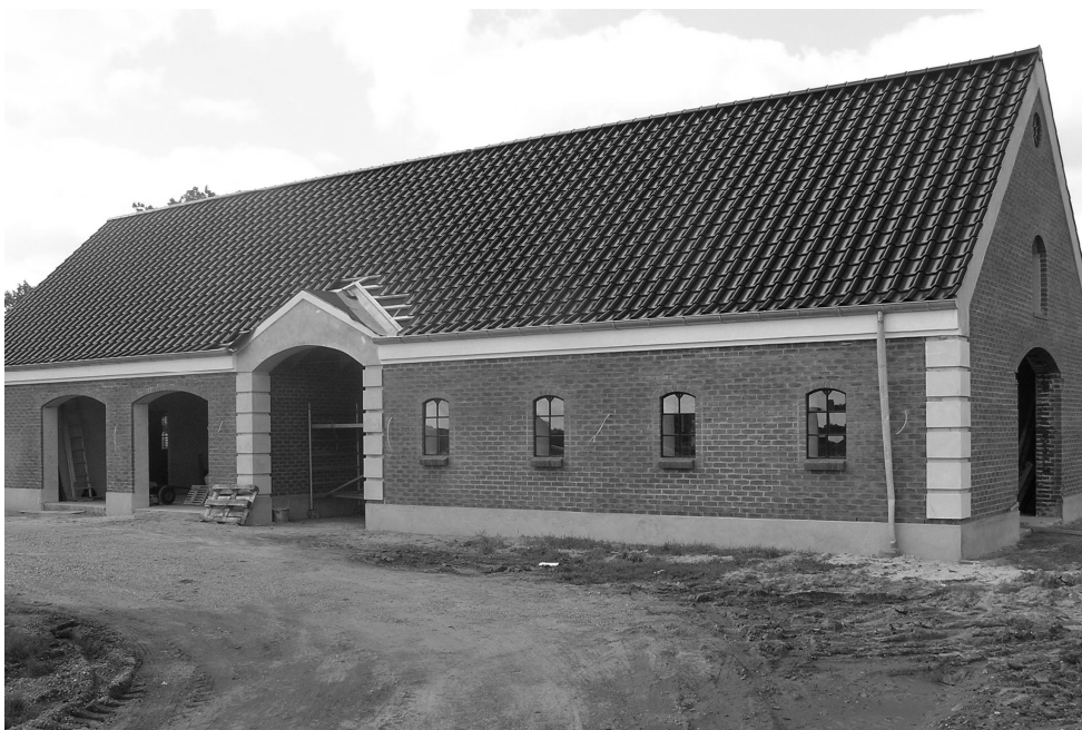
Byggeri ved Møllegården