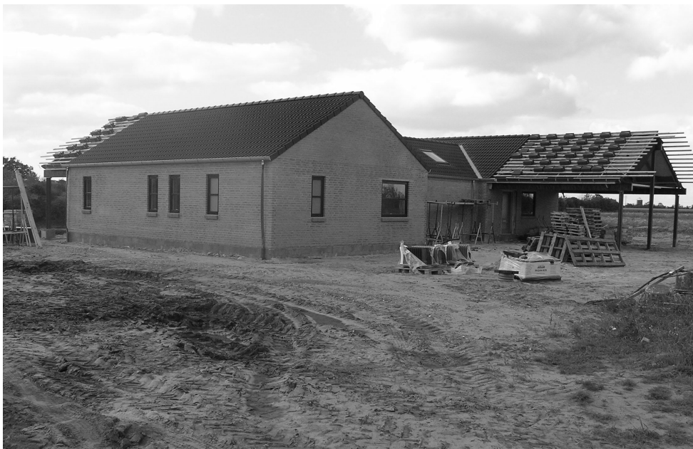
Byggeri på en storparcel på Nørlundvej