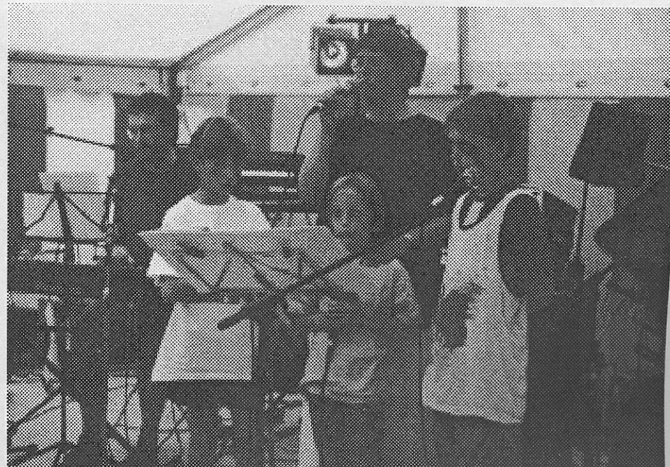
Fillipsmidt's & Co. spillede ved landsbyfestivalen i forbindelse med landsbyfesten.

Tina Højtoft Frøerlundvej 5, 75 17 41 31