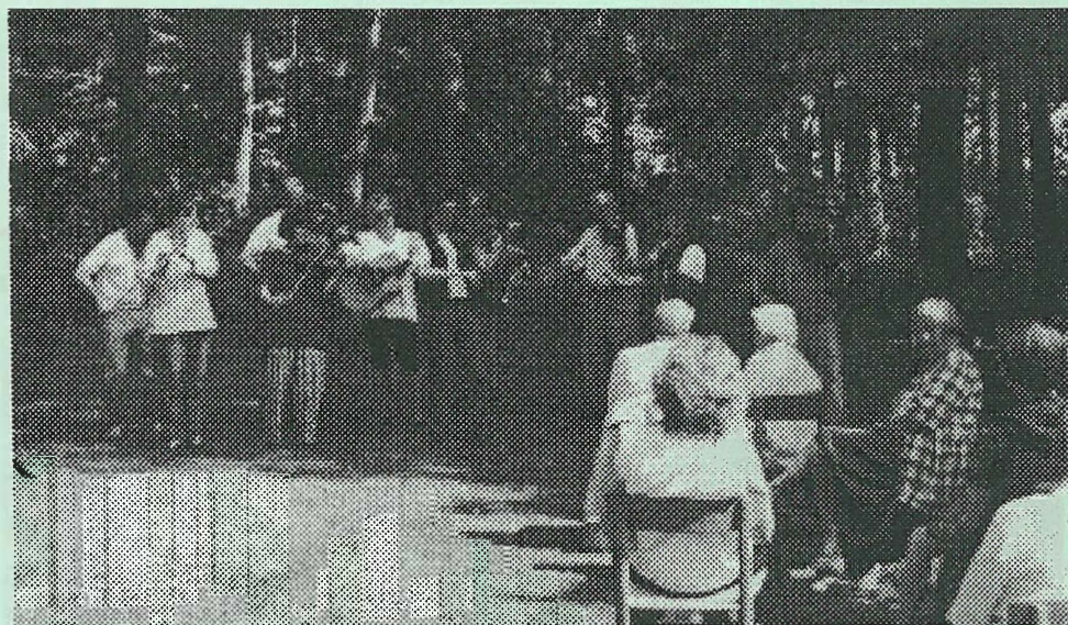
Gruppen „Revl og Krat“ underholdt i forbindelse med grundlovsfesten på Riber Kjærgård Landbrugsskole.