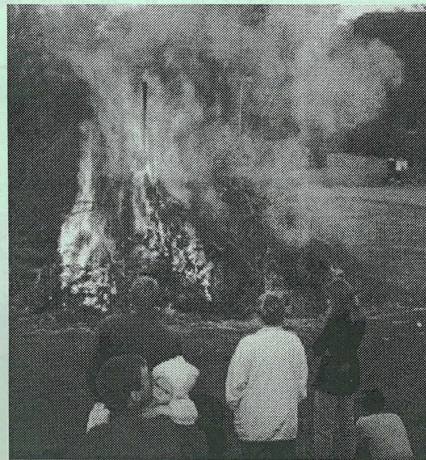
Sankthansbål på Kirketoften.