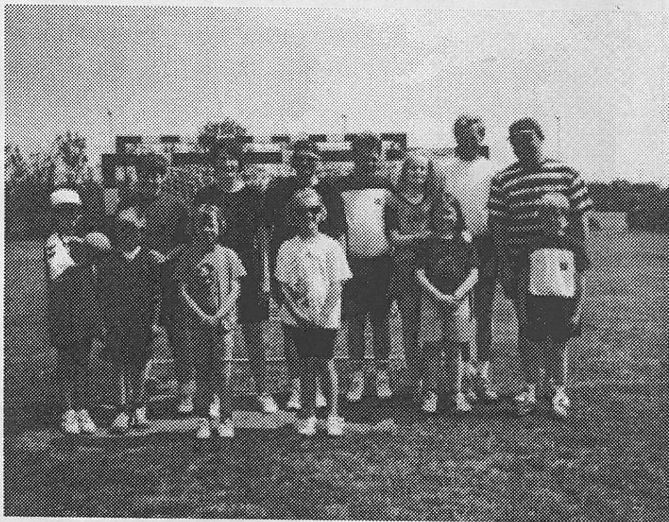
Ved landsbyfesten spillede forældre håndboldkamp mod børnene fra årgang 88/89.