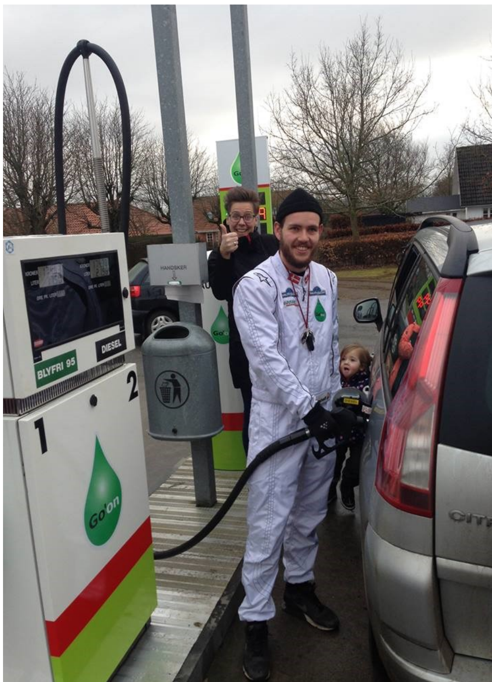
Der blev solgt billig benzin og diesel ved åbningen - til tydelig tilfredshed hos flere kunder.