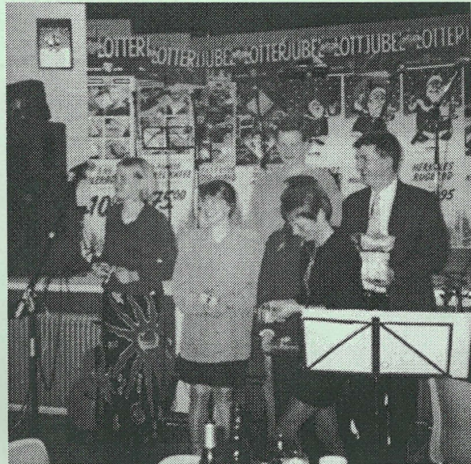
Medarbejdere i Brugsen, Hunderup, får overrakt gaver i anledning af brugsens 50-års jubilæum.