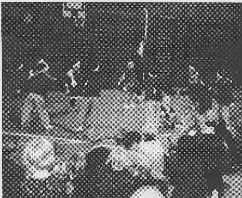
Børnehaveklassen opfører et lille skuespil ved skolens juleafslutning.