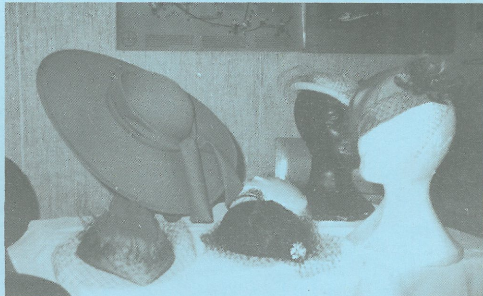
MERE FRA HATTEKURSET