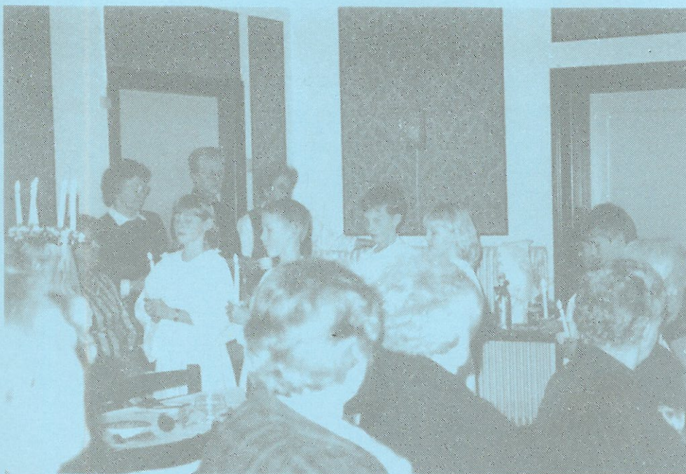
3. KLASSES BESØG I HYGGEKLUBBEN