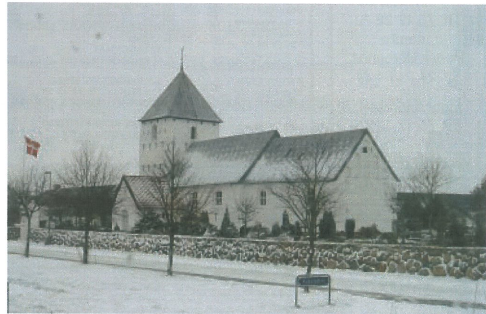
Hunderup Kirke En snevejrdsdag for et år siden