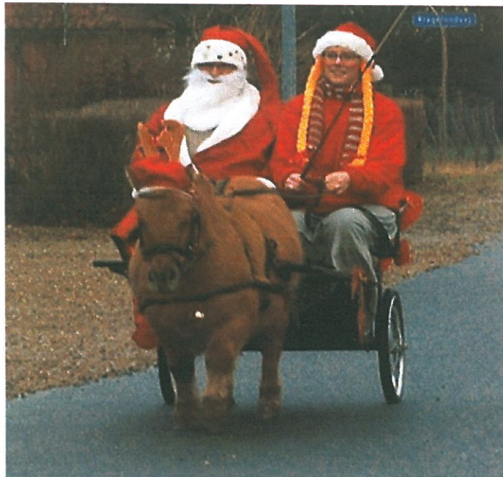
Nissefar og nissemor på vej til Brugsen