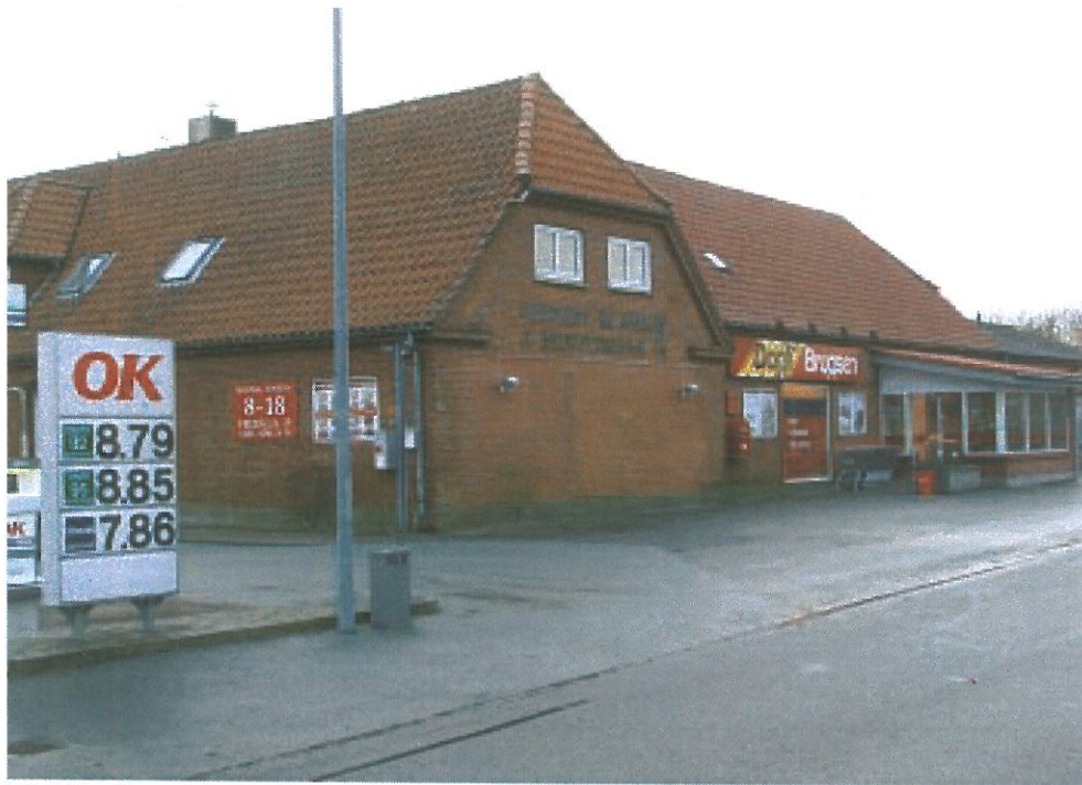
Hunderup Brugs 2007