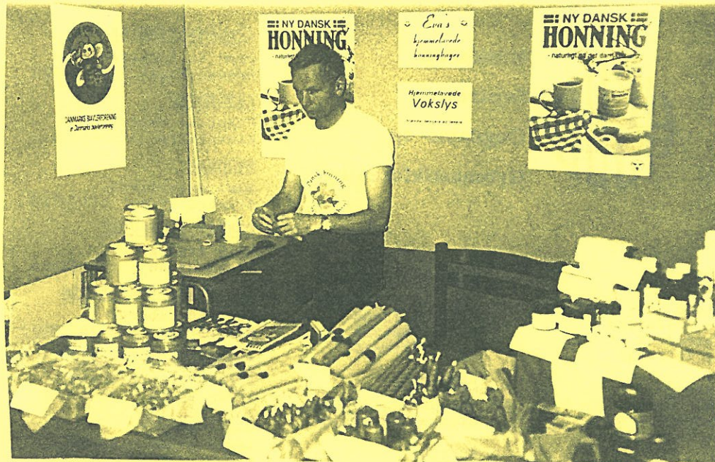
ELLIF PÅ UDSTILLINGEN

Juleafslutning på skolen. Kl. 8.15 - 9.30 hygger man sig i klasserne. Derefter står 5. klasse for arrangementet. Kl. 10 går vi i kirken for at synge julesalmer og høre juleevangeliet. Derefter laver b.h. klassen, 1. klasse og 2. klasse små julespil i idrætssalen. Forældre, bedsteforældre og børnehaven er velkomne. Og så er der juleferie til den 3. januar.