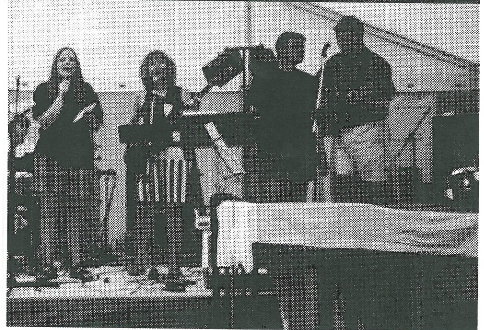
Åbningssangen fra Landsbyfestivalen 1997.