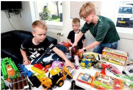
Et stemningsbillede fra forårsmessen i 2018