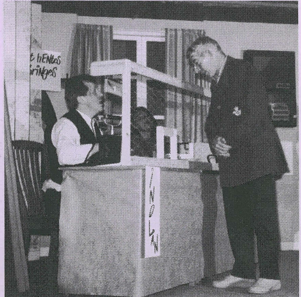
Billederne i dette nummer er fra Amatørteaterforeningens opførelse af „Eggerød Bank“.