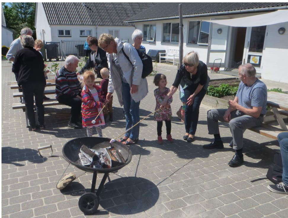
Bedsteforældredag i Børnehaven.