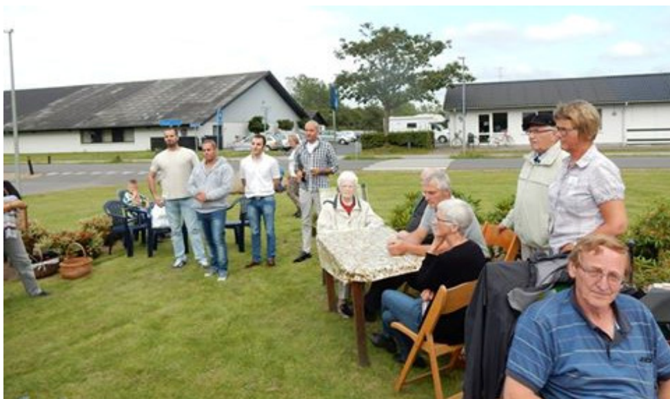
Fællesspisning og velkomst til de syriske flygtninge.