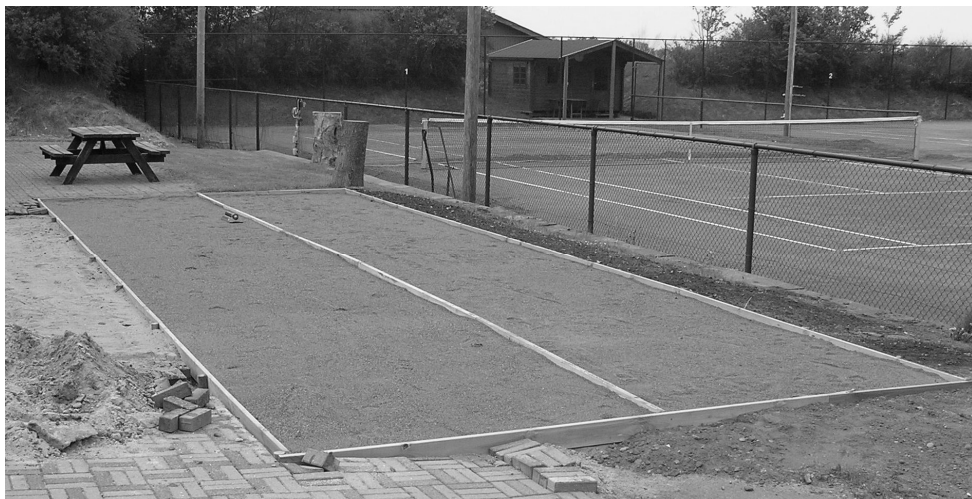
De nye petanquebaner ved hallen