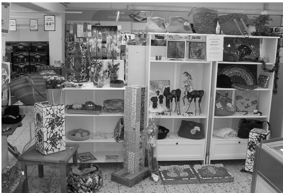
Eksempler på "Ideforums" produktion udstillet ved købmanden