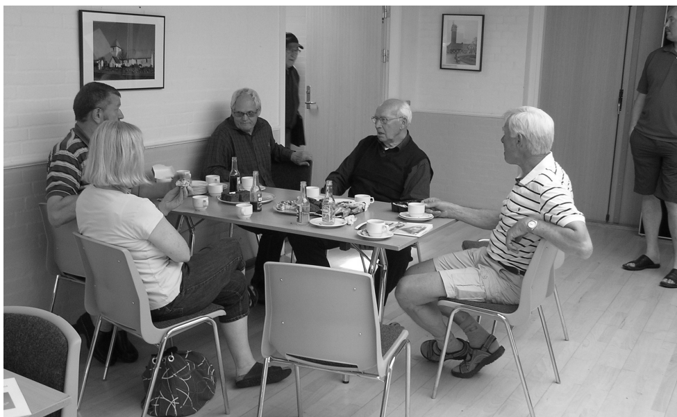
De lokale var klar til at tage imod gæster til "Åben landsby"