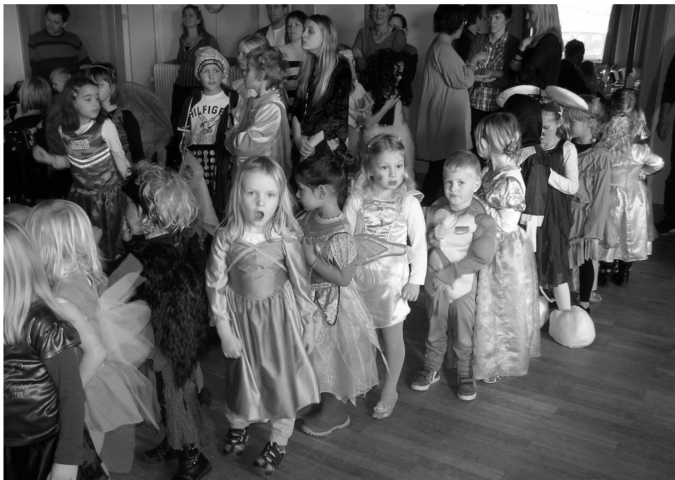
Mange børn til fastelavnsfest