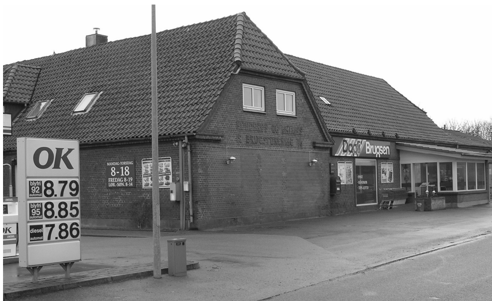
Hvem kan huske det? - Bagsiden af Landsbyposten februar 2007 - Bemærk priserne!