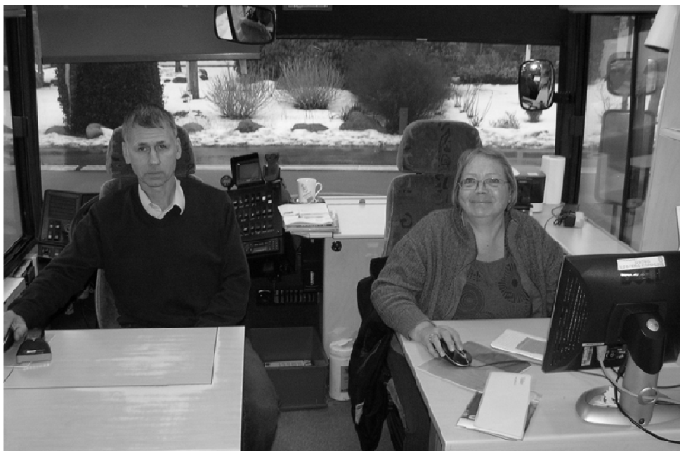
Personalet sidder klar til at hjælpe

Det kan være en god ide at kontakte bogbussens personale på forhånd ved at ringe på tlf. 24 59 62 48 fra mandag til torsdag kl. 14.00 – 19.30. Jeg blev f.eks. overrasket over at konstatere, at der udleveres batterier til høreapparater, ligesom man også kan få hjælp til brug af computeren.