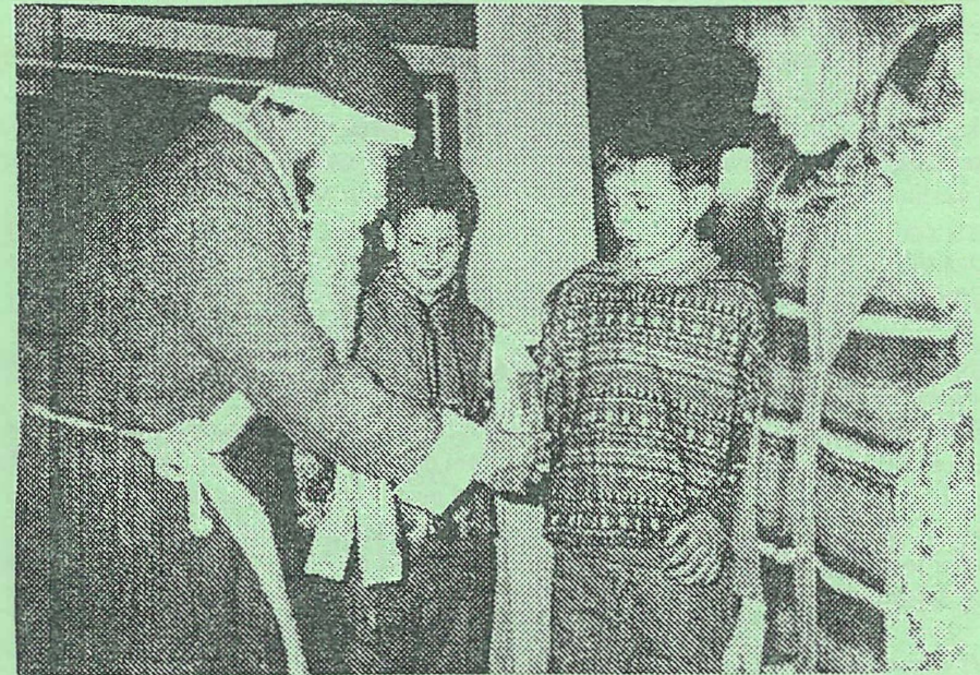
SIG NÆRMER DEN SØDE JULETID