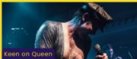
Keen on Queen