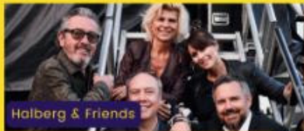
Halberg & Friends