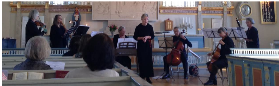
”Valkendorferne” ses her ved en koncert i Långaryd Kirke i Sverige

Ensemblet ”Valkendorferne” spiller musik fra middelalder- renaissance- og baroktiden. Koncerten er særlig aktuell i år, hvor vi fejrer 500-året for reformationen. Ensemblet vil nemlig både spille, synge og fortælle om melodierne til de salmer, som man begyndte at bruge i årene umiddelbart efter reformationen. Martin Luther spillede både lut og fløjte, og han komponerede selv flere salmelodier. Noget af musikken som Valkendorferne” vil præsentere os for, bruges den dag i dag i den danske folkekirke. Publikum vil i løbet af koncerten få mulighed for at synge med på nogen af salmelodierne akkompagneret af det 7 mand store ensemble på henholdsvis violin, gambe, blokfløjte, cello, fagot, cembalo og sang.