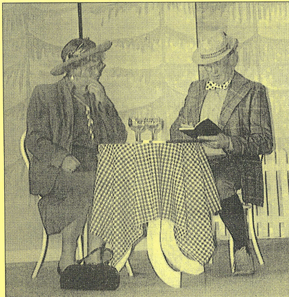
Arkivfoto fra Amatørteaterforeningens opførelse af stykket "På valsen".