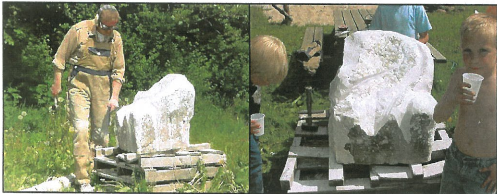
Stenhugger på besøg i SFO