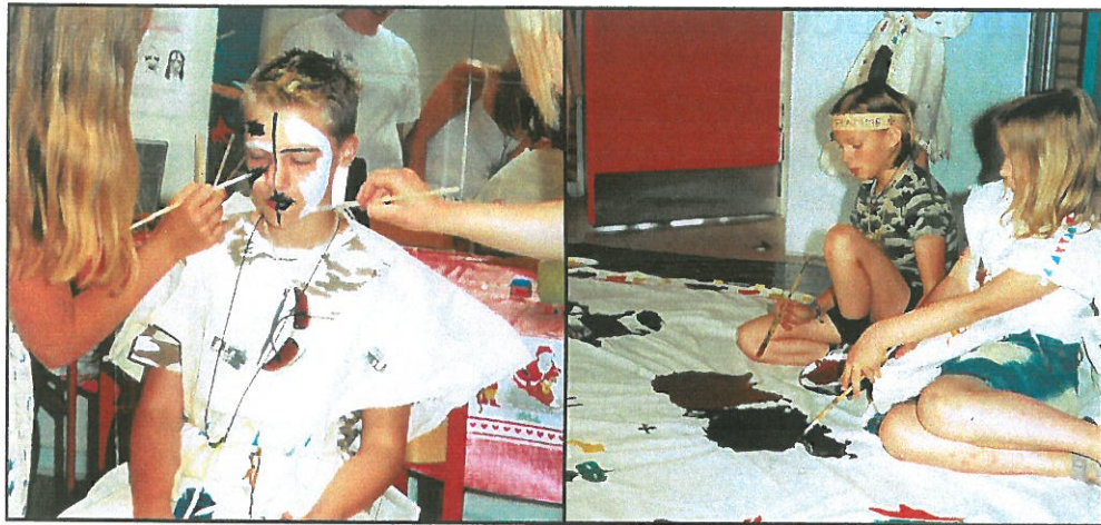
Emneuge på skolen