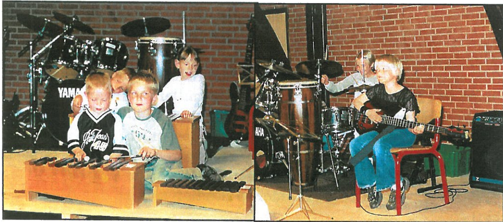
Sommerkoncert i HSI