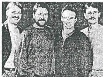
Antonius. Irsk-amerikansk folkemusik fra 60'erne - 70'erne. Godt at lytte til, men mange føler sig også hildet til at danse. "Førrygende musik - talentfulde musikere med humør i hatten"

Traditionen tro foregår dette arrangement i Hunderup Hallen.