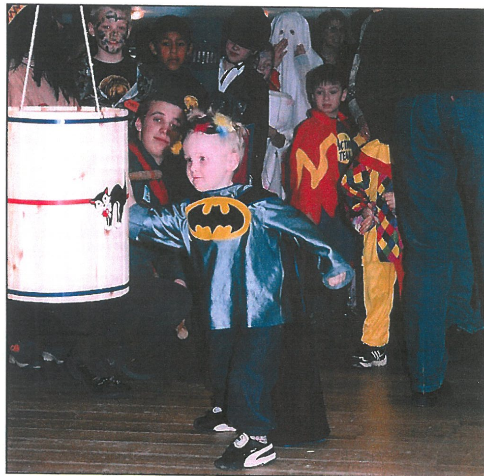
Fastelavn er mit navn...