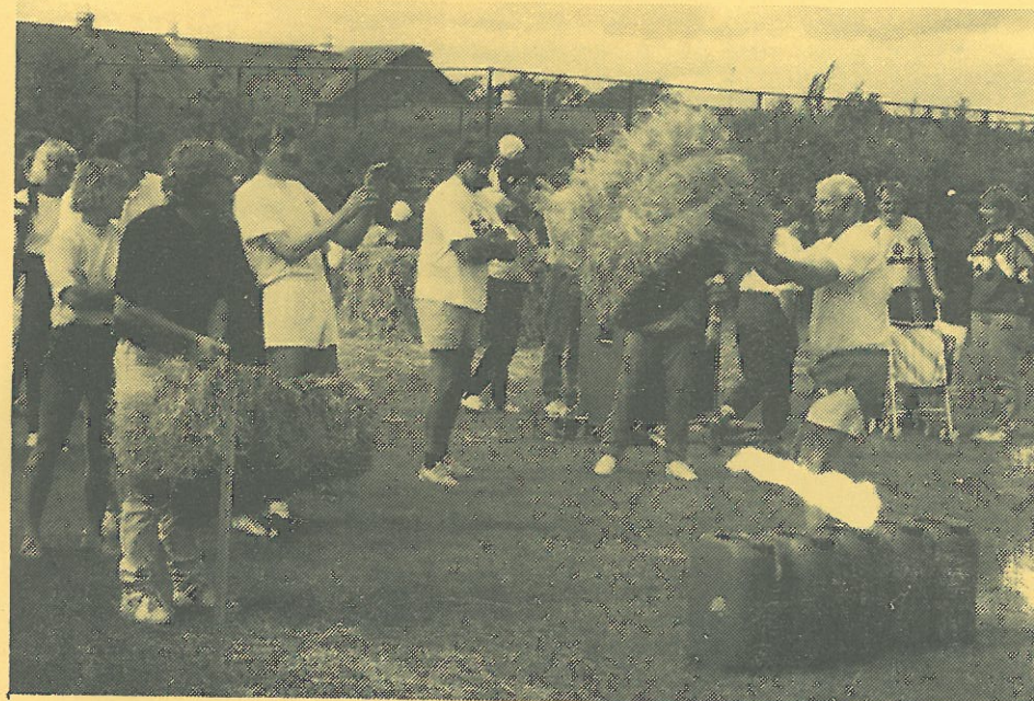
NY TEKNIK I HALMBALLEKASTNING