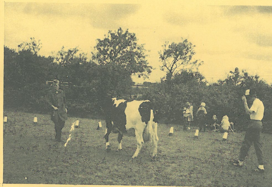
OLE WIND KIGGER BETÆNKELIGT PÅ KOEN