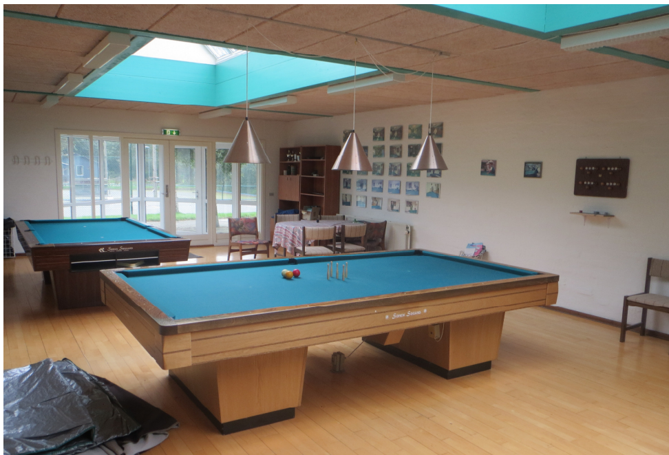
Vores indbydende billardlokale i HSI