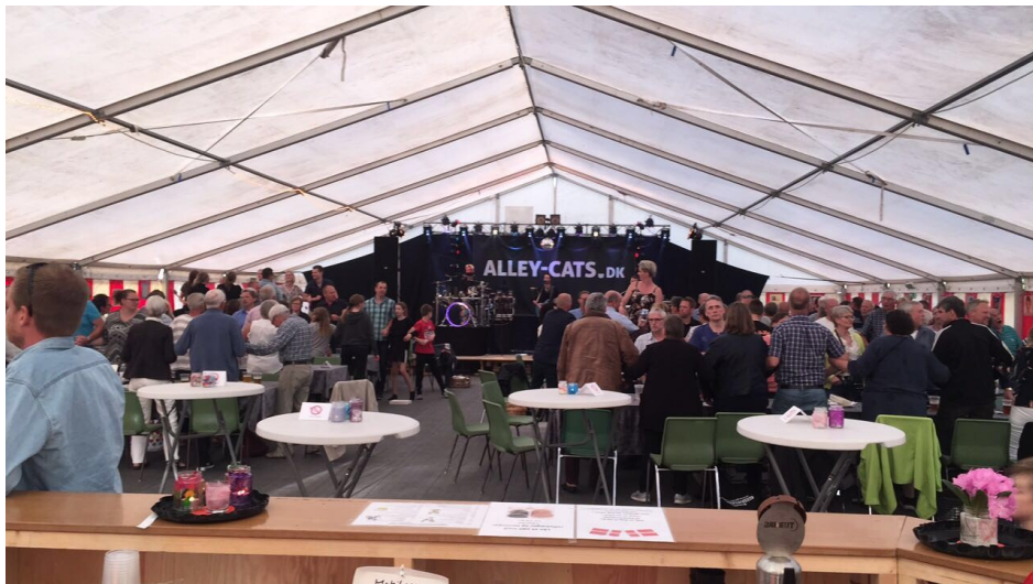
Fællessang til Landsbyfesten 2017