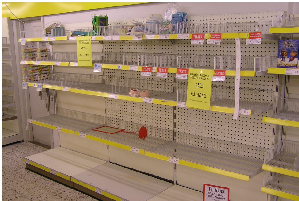
Situationen før Brugsens lukning den 28. december.