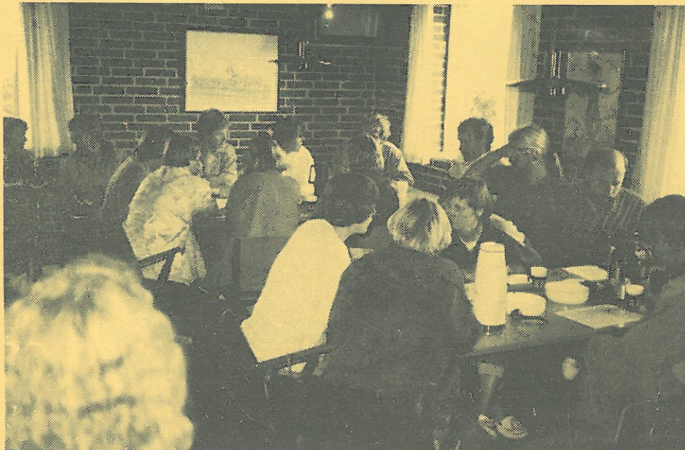
FORÆLDREOPBAKNINGEN ER STOR I SOGNET