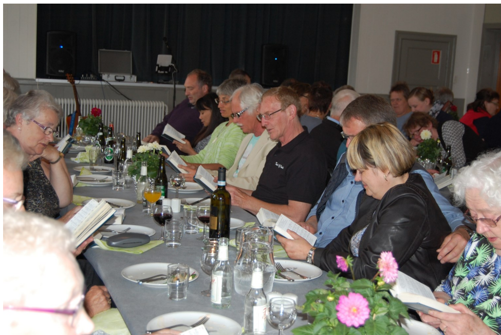
Der var en god stemning til fællesspisning i forsamlingshuset fredag den 20. maj