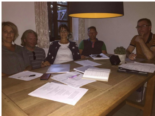
Idegruppen på overarbejde

Da der samtidig er lavet aftale med ”Kupmagerne” om den musikalske opbakning til forestillingerne, har vi på orkester og instruktørsiden den samme besætning, som også stod bag ”Vimmersvej” i 2015.