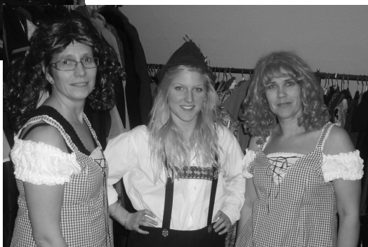
Klar til alpe-tur !