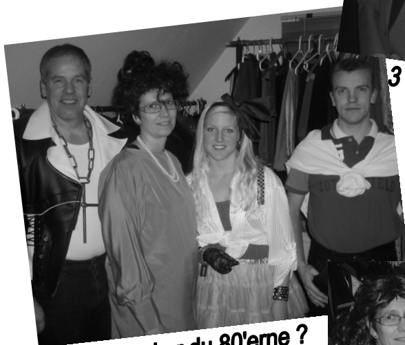
Husker du 80'erne ?