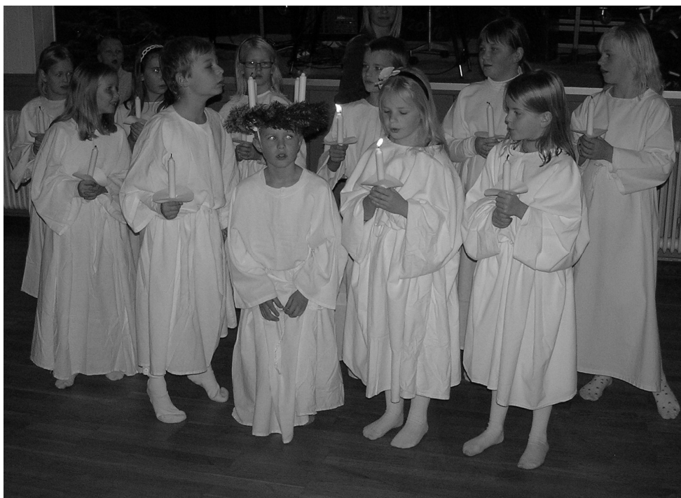
Luciaoptøget ved juletræs festen