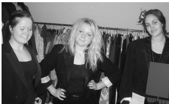
3 noble dansepiger !