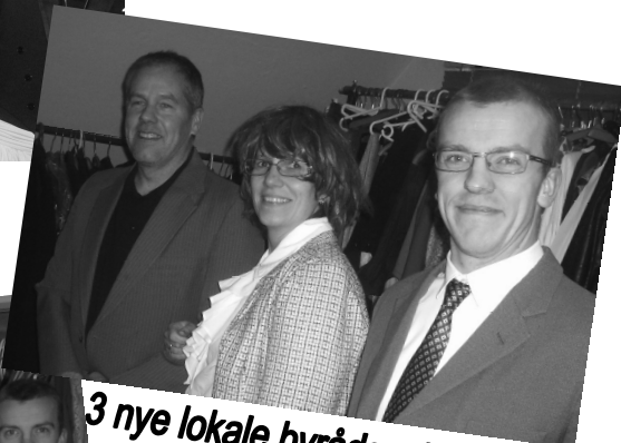
3 nye lokale byrådspolitikere ?