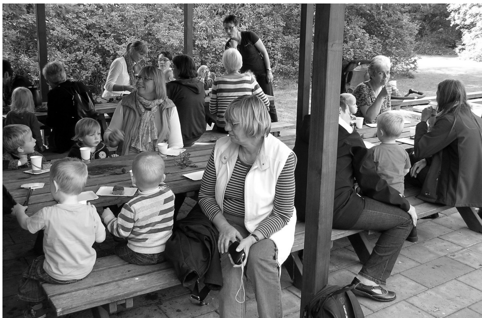
Daglejen holdt bedsteforældredag ved Kratskellet.