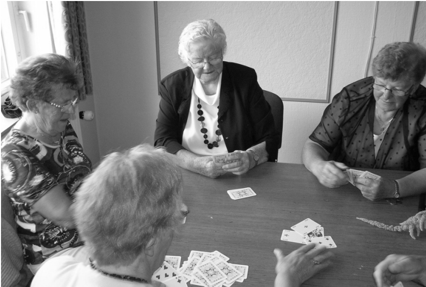
Naturligvis var der kortspil