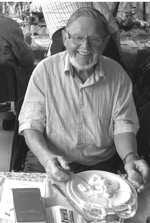
e med fra start i 1971