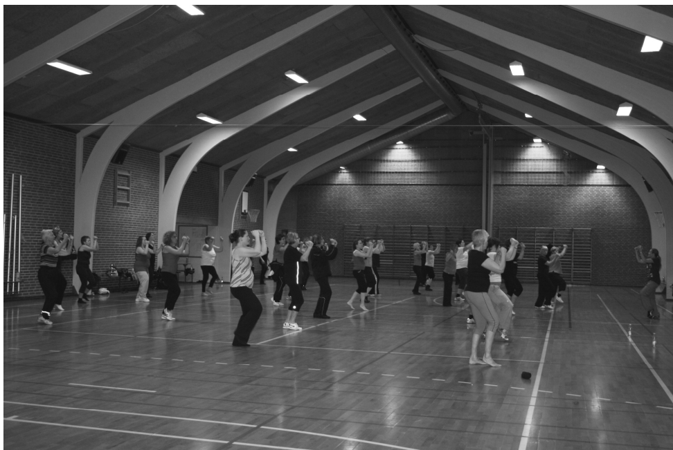
Zumba - Starter igen den 3. januar.