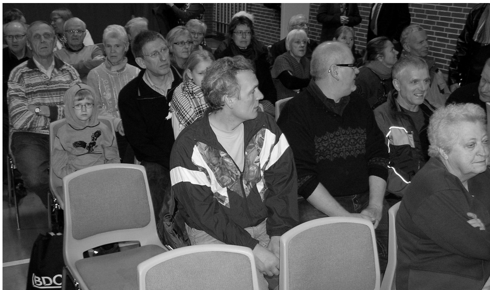
Fra borgermødet om skolens fremtid.