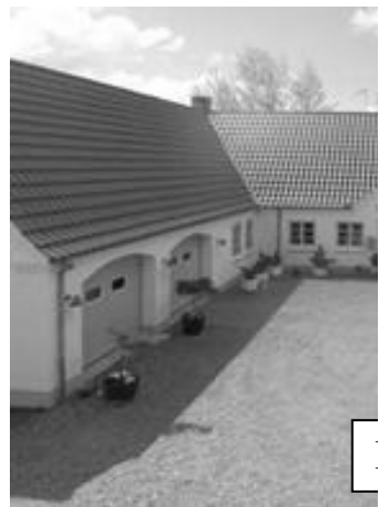
Fundet på boligsiden.c