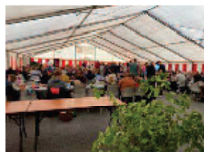
Stemning på Høje Høje efter indtækt.

Tilfældet var allerede rejst, men hvor mange ville komme, hvordan ville stemningen være? Nu måtte det briste eller bære.