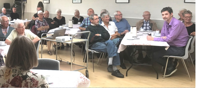
Et par stemningsbilleder fra Landsby Postens 40-års jubilæum