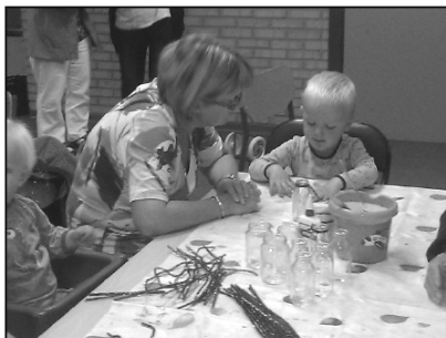
Der blev klippet og klistret.