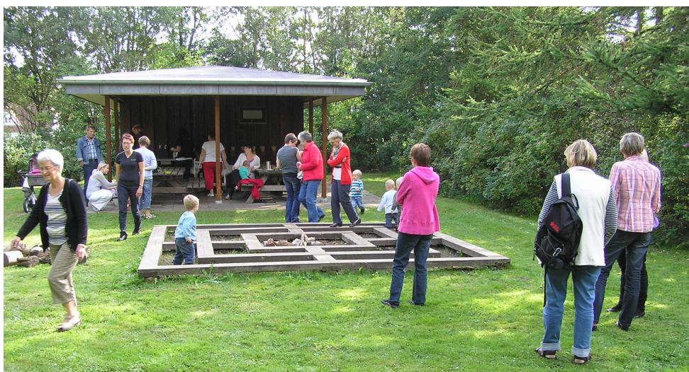
Dagplejen holdt bedsteforældredag ved Kratskellet.