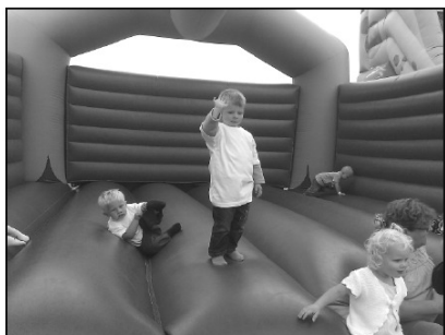
Efter optøget i Gredstedbro, var der tid til hoppeborg.