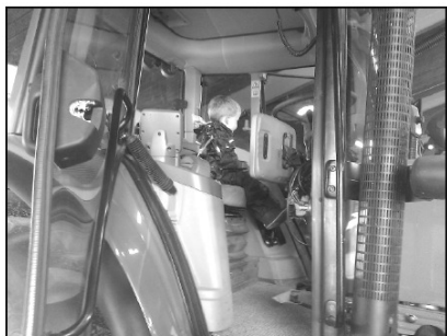
Det er fedt når man får lov til at sidde i en af Riber Kjærgårds traktorer.