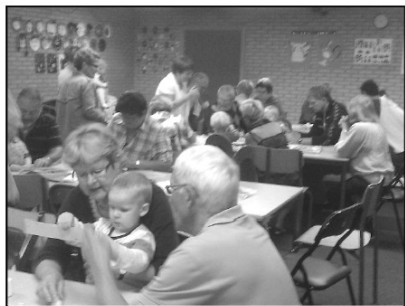
Der var en stor tilslutning til bedste- forældredag. Det var en rigtig dejlig dag.