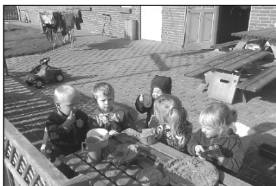
Når solen skinner er der ikke noget som at lave det store " ta' selv bord " – sandkage på mange måder.