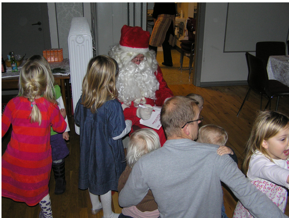
Husk årets juletræsfest den 4. december