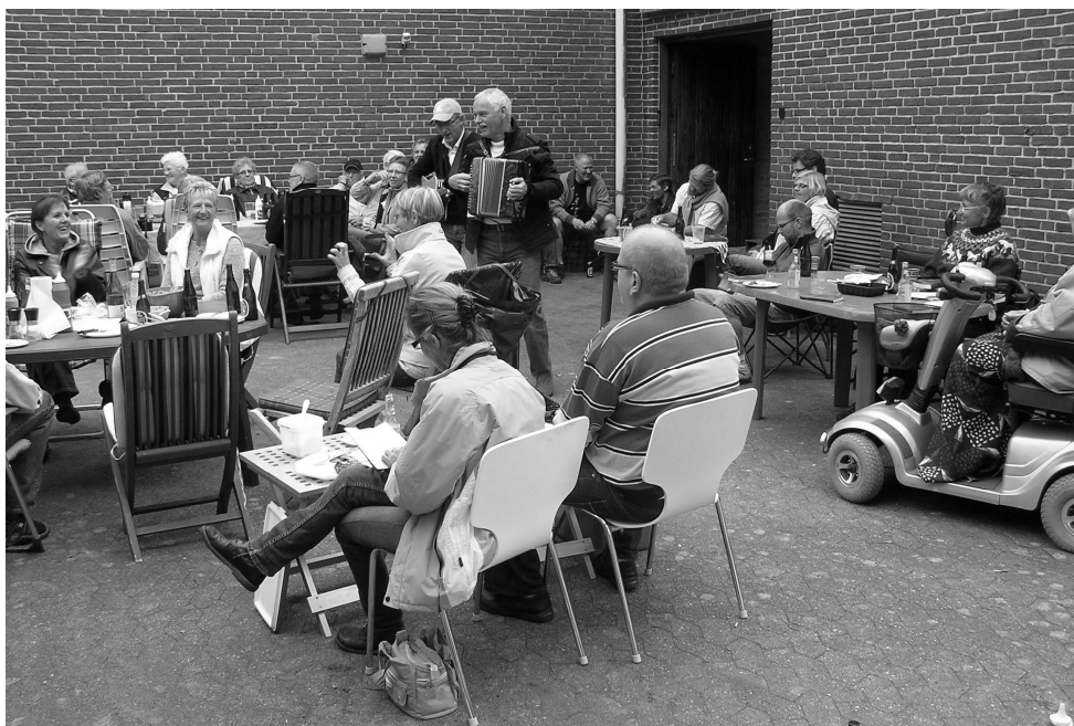
Grillaften ved vandværket.