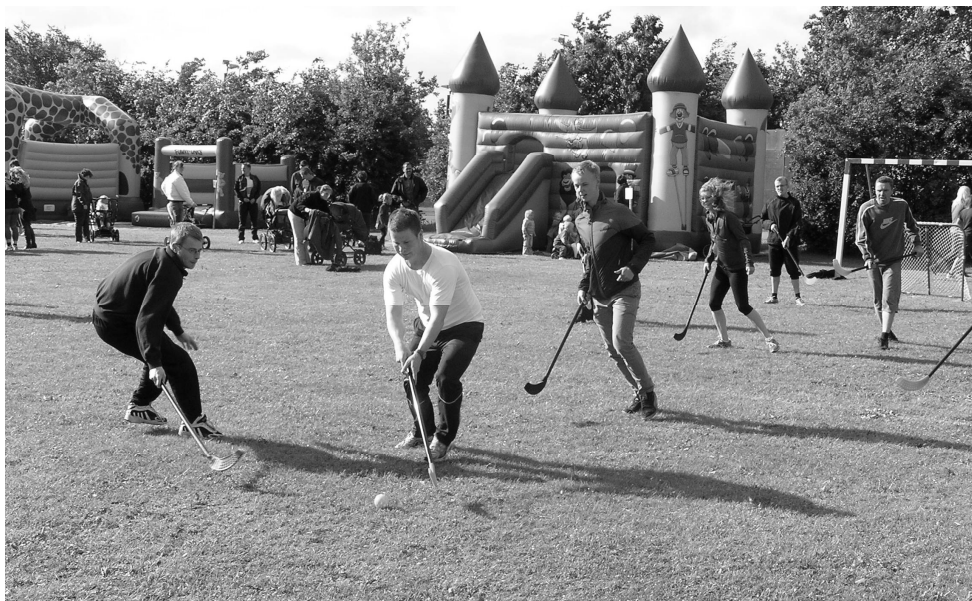
Fra Landsbyfestens hockeyturnering.