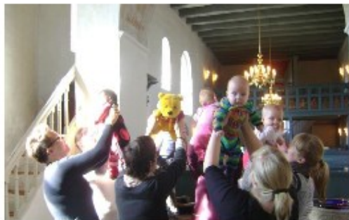
Foto fra babysalmesang i Vilslev kirke marts 2014

Babysalmesangen foregår seks torsdage med opstart torsdag d. 3. marts kl. 10 - 10.40 med efterfølgende kaffe/thé i konfirmandstuen.