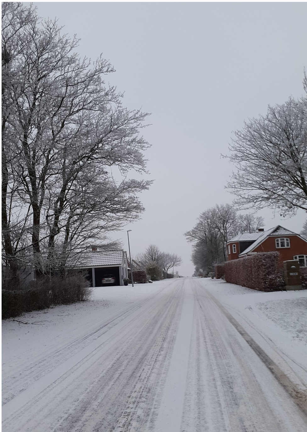
Vinteren lod vente på sig. Her er Hunderup i vinterklæder.