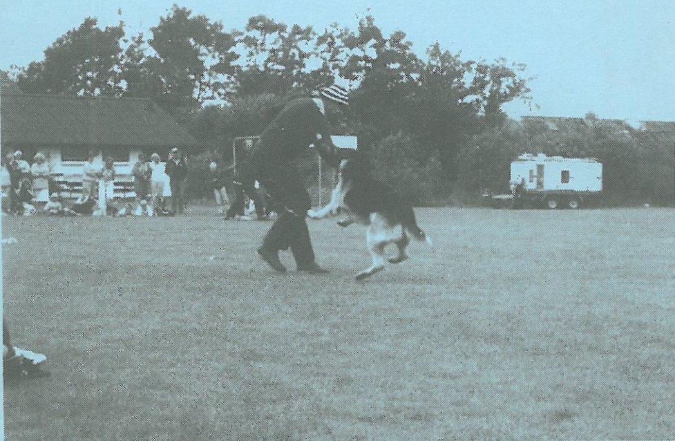
DER VAR BID I LANDSBYFESTEN