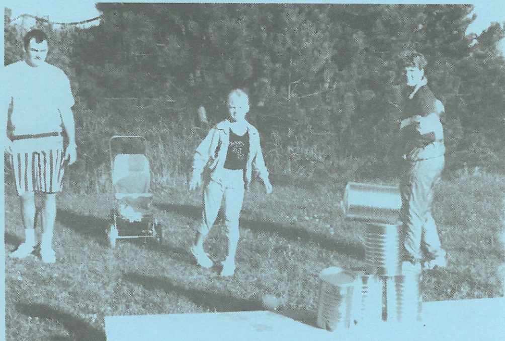
KONCENTRATION UNDER SKATTEJAGTEN