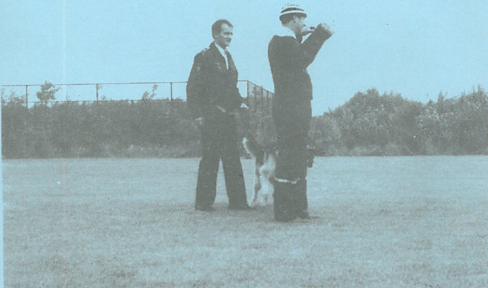
"FORBRYDERJAGT" VED EN FORNEM HUNDEOPVISNING