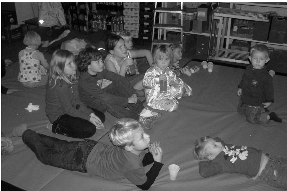
Børnene hyggede sig og så Disney Sjøv...