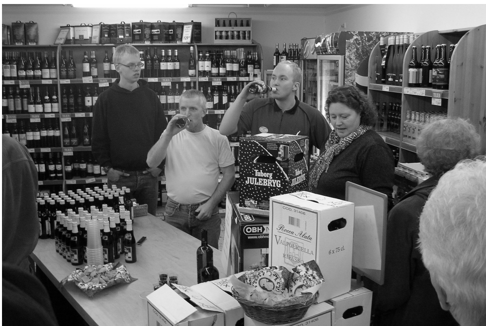
Mens der blev udskænket juleøl til de voksne i Brugsen.