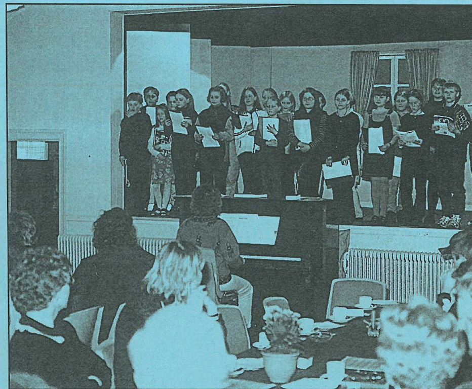
Sogneudvalget havde arrangeret familieaften i forsamlingshuset tirsdag den 13. april med fællessang, quiz og korsang. Her synger kor 1 og 2 for publikum.