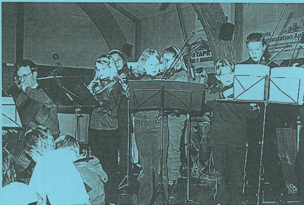
Eleverne fra musikskolen i Bramming kommune var til musiktræf i Darum den 23. marts 1999.