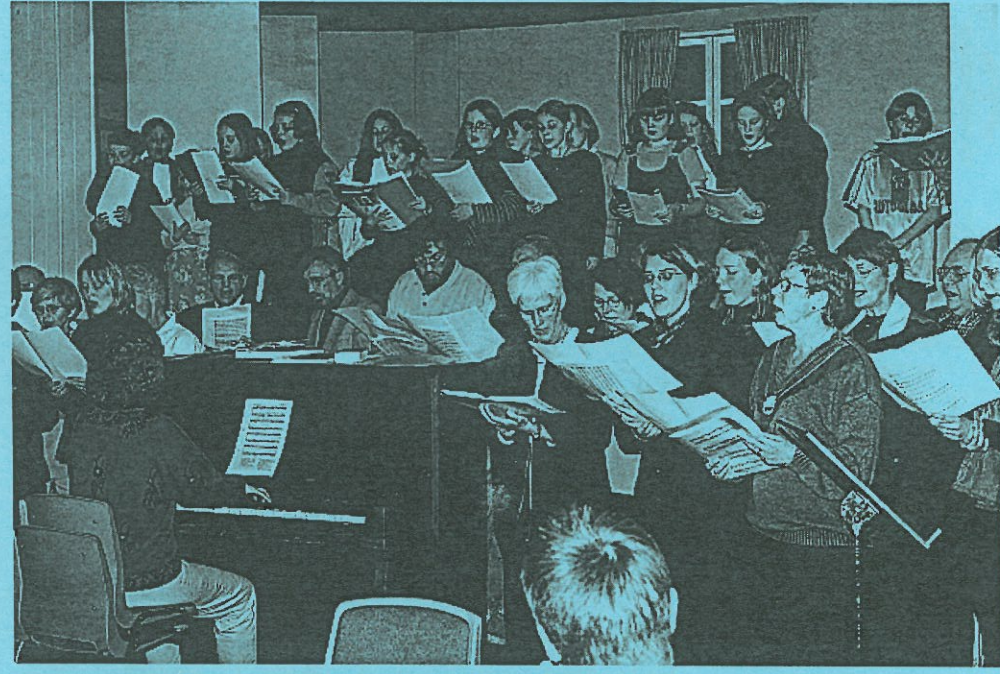
Familieaften i forsamlingshuset: Kor 1 og kor 2 synger sammen med Landsbykoret