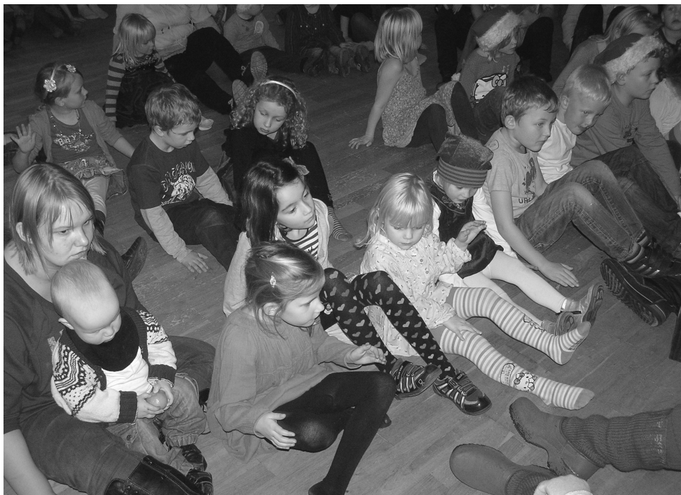
Fotos fra juletræs festen.