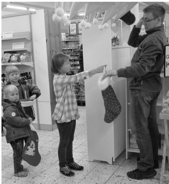
Fotos fra 1. december, hvor juletræet blev tændt ved Kwik Spar