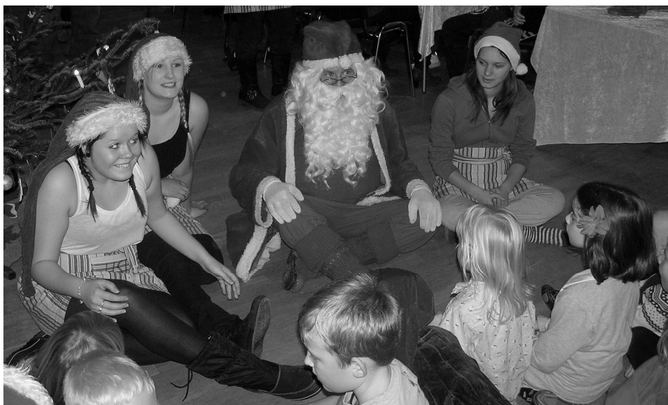
Nissepiger og julemanden underholder børnene ved juletræsfesten.