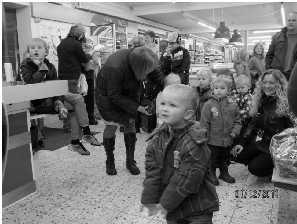
Spændte børn kiggede efter julemanden.