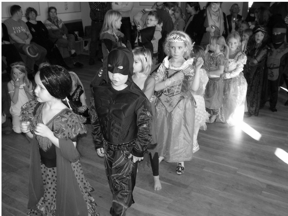
Husk fastelavnsfesten den 19. februar.