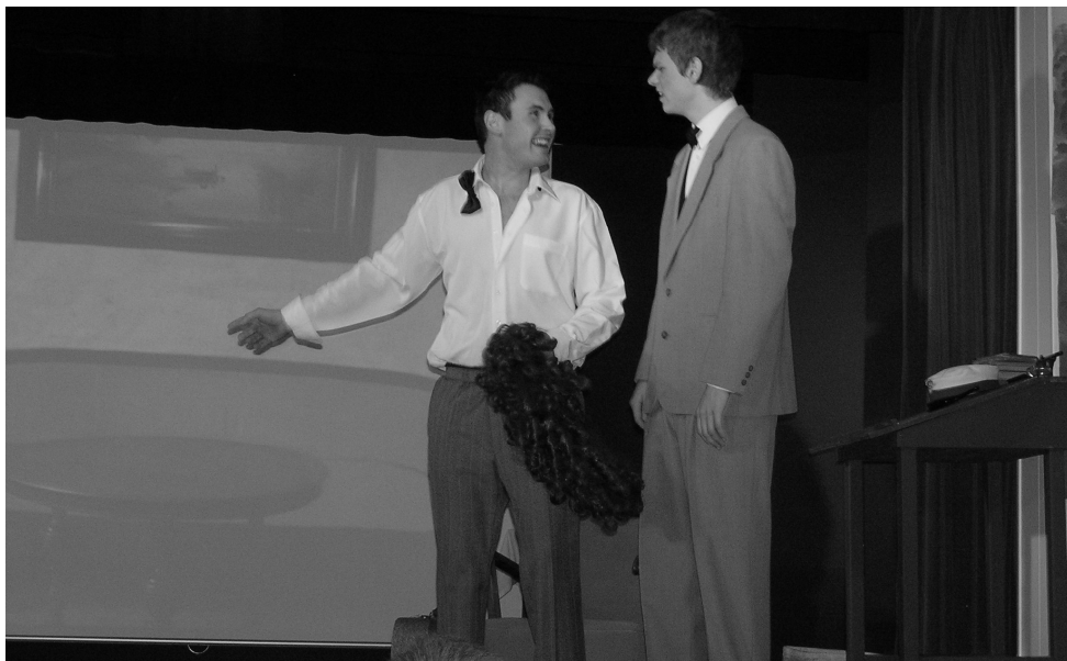
Klar til omklædning som Charleys tante.