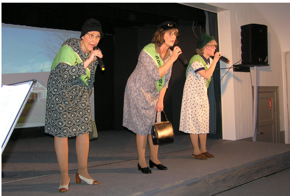
Landsbyscenen søger aktører til vinterens forestilling