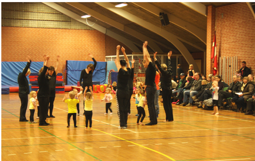
Husk gymnastikstart i september