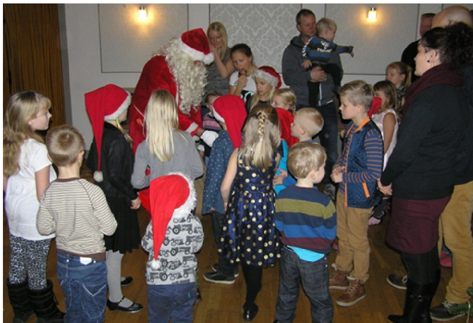
Børnene var glade for at hilse på julemanden ved juletræsfesten.