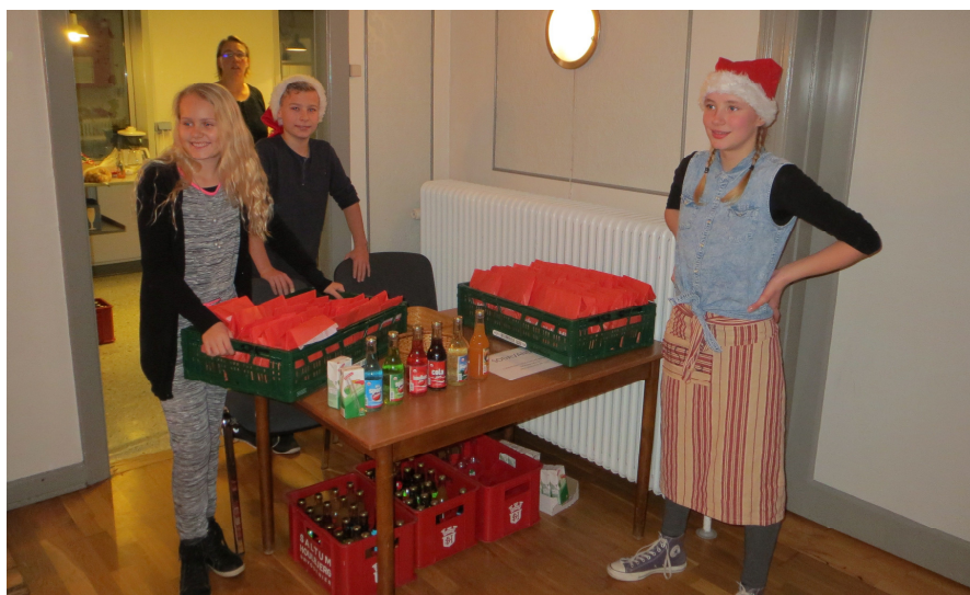
Dygtige unge hjælpere til juletræsfesten