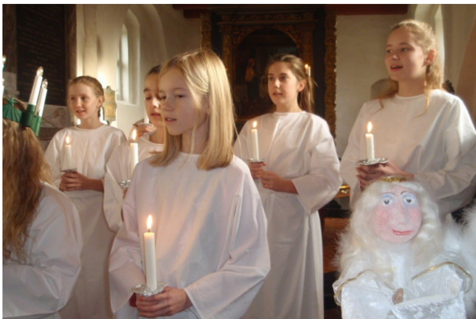
Lucia-optog i Hunderup kirke