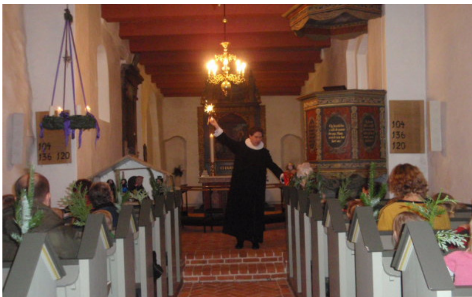
Gudstjeneste i børnehøjde. Præsten genfortæller juleevangeliet.