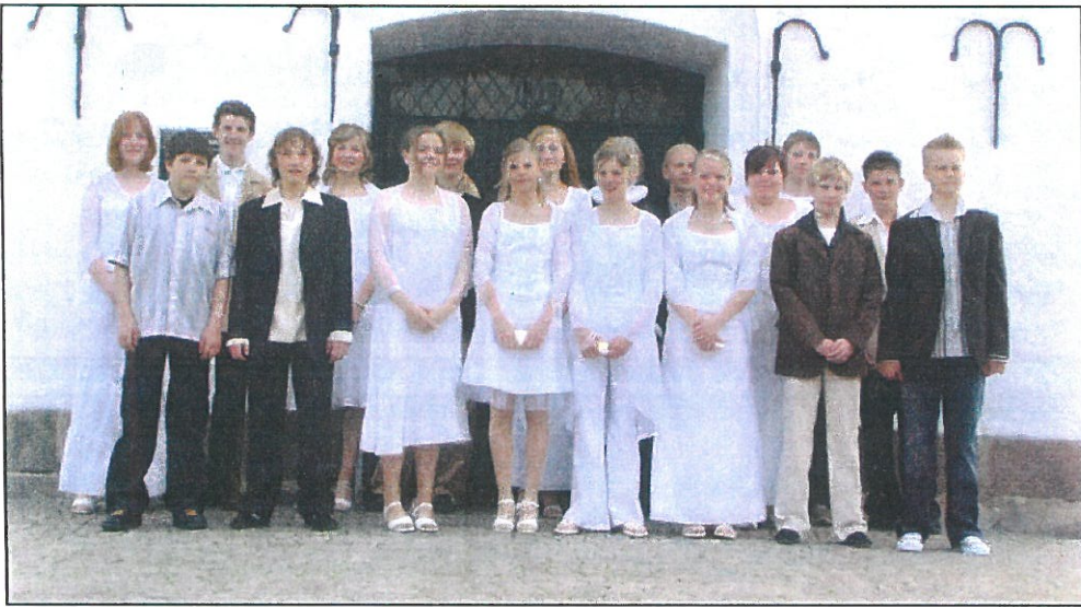
Konfirmanderne ved Hunderup Kirke 2004