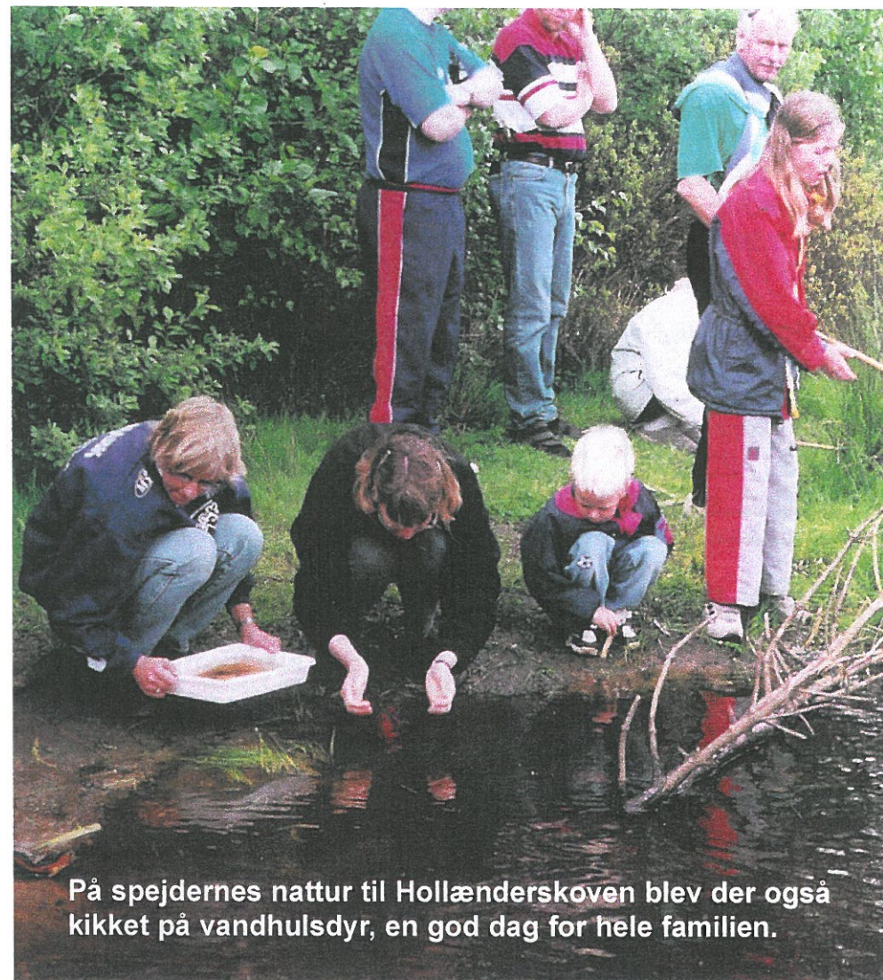
På spejdernes natur til Hollænderskoven blev der også kikket på vandhuldsdyr, en god dag for hele familien.

Indlæg til Landsbyposten kan også afleveres på diskette eller sendes på e-mail til fabricius-hunderup@mail.tele.dk