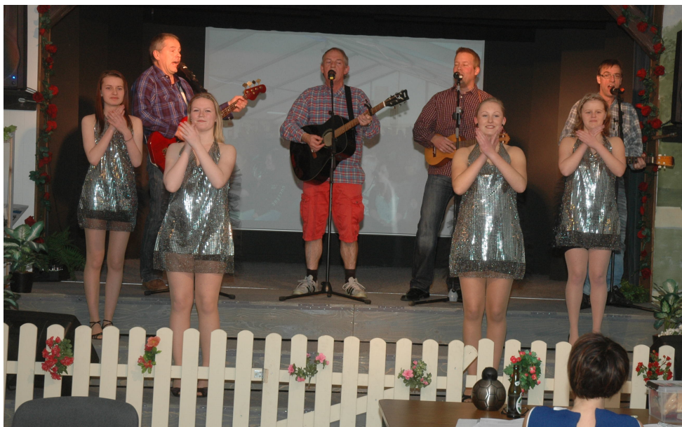
Fra årets Cabarevy