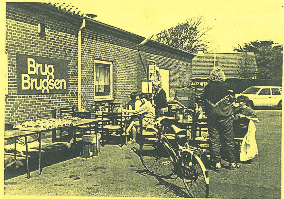
Fra en hyggelig markedsdag foran BRUGSEN