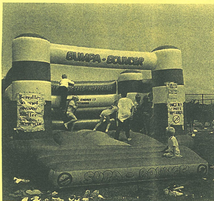
Hoppeborgen gav mange muntre timer