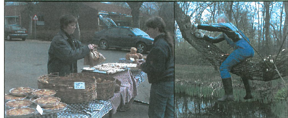
Torvedag ved Brugsen med god stemning og godt vejr. Ved forårsrengøringsdagen på fællesarealet ved tingstedet/træmændene blev der arbejdet ivrigt med rengøring, græsklipning, beskæring og træfældning.