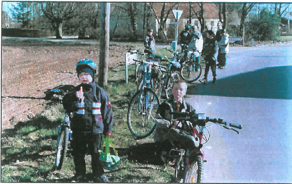
Billed fra KFUM Spejdernes jagt på kæmpekrabberne og Lahmaj Gén Laden. Se historien inde i bladet.