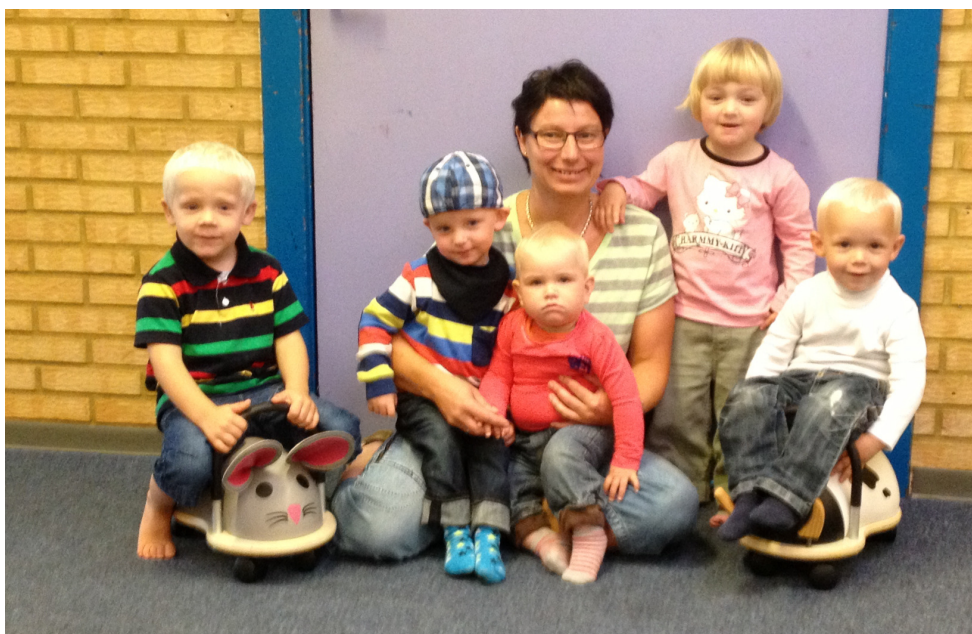
Fra Bentes private dagpleje.