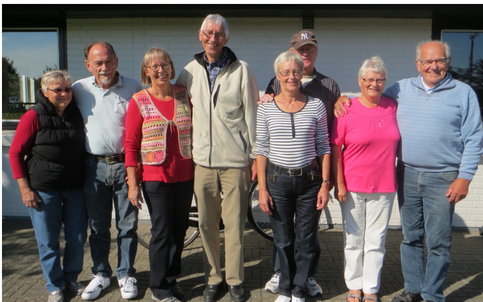
Finaledeeltagerne i seniorklubbens petanqueturning