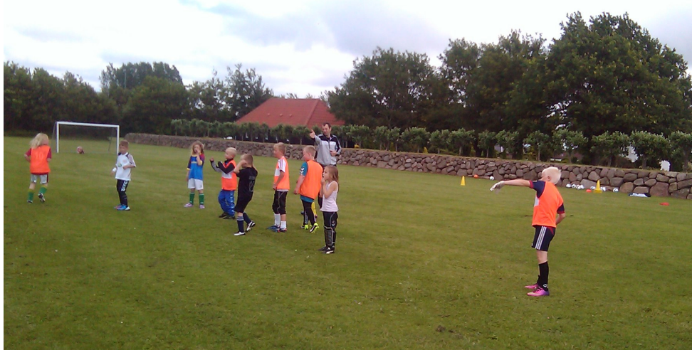
Unge fodboldspillere til træning