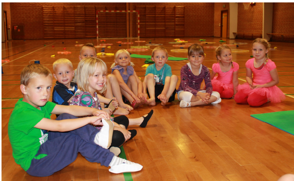
Gymnastik for gruppen 5 år - 0. klasse.