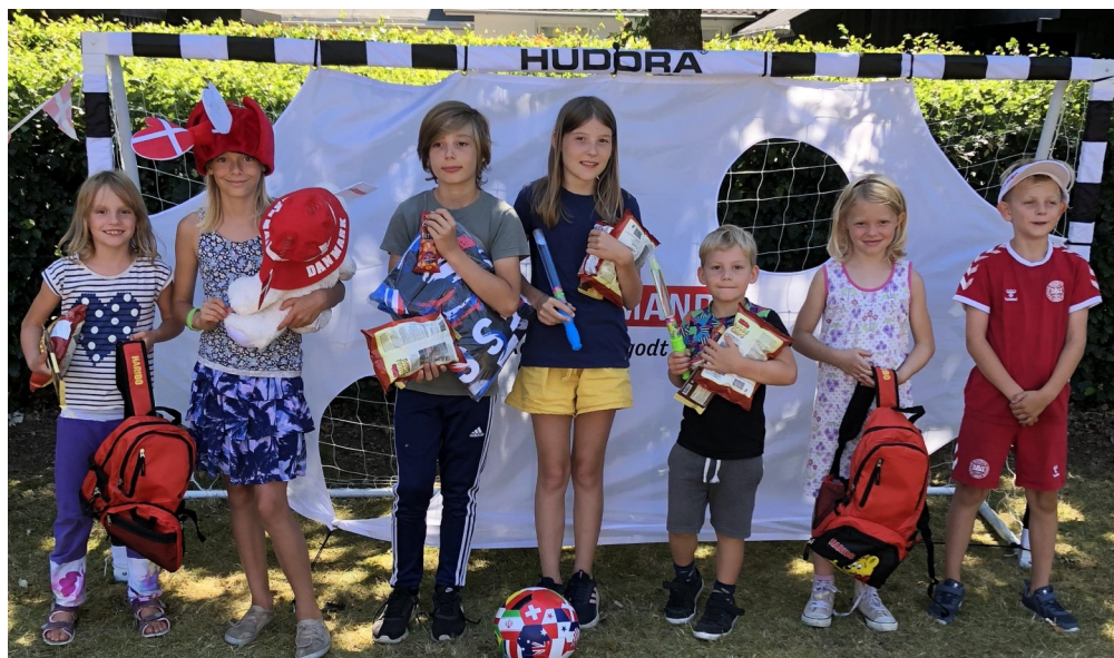
VM hos Min Købmand