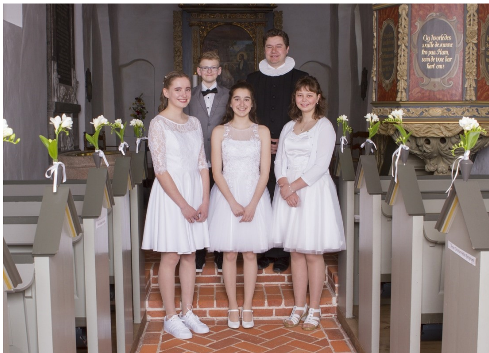
Årets flotte konfirmander som blev konfirmeret den 7. maj 2017 i Hunderup Kirke.

Formand: Mette Fredslund Kirketoften 11, Hunderup 75 17 40 32, 30 13 23 72