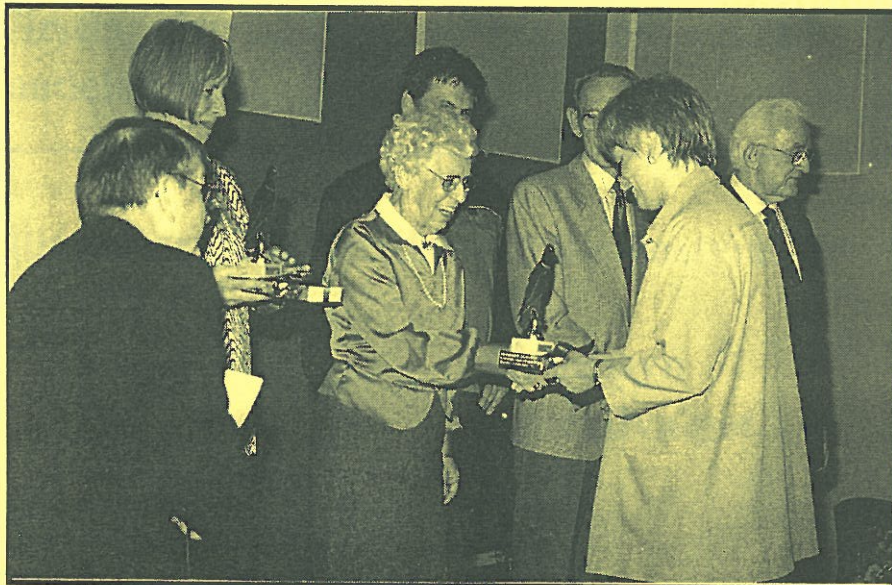
Fra overrækkelsen af Rosenørnprisen, ved premieren af Landsbyfilmene